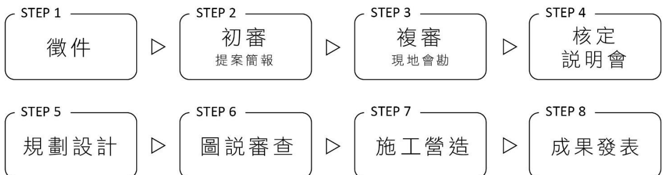
圖 1 計畫執行流程圖

以影像記錄執行過程，並透過記者會或其他形式，公開發表本案成果，介紹合作學校之原住民族文化學習場域營造成效，作為計畫示範學校。