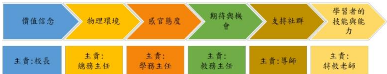
融合教育學習環境的建立要素及主責圖

融合教育的學習環境係指支持所有學習者透過彈性、可獲得及包容的課程，實施以學生為中心的學習及教學，以滿足個別化及適性化的特殊需求，並以發展正向支持社群為目標，促進融合教育學習環境的建立要素有價值與信念、物理環境、感官態度、期待與機會、支持社群及學習者的技能與能力。